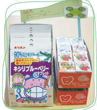
歯医者さんでしか買えない高濃度キシリトール配合のタブレットやガムをおやつに取り入れると効果的

加えて、おやつの食べ方にも注意が必要です。子どもが好む甘いおやつには虫歯の原因となる砂糖が多く含まれており、おやつの回数が多かったり、ダラダラと飲食している、虫歯のリスクは高まります。時間と食べる量を決め、できるだけ砂糖の少ないおやつを選びましょう。ジュースの量を徐々に減らしたり薄めたり、甘いおやつを食べたらお茶や水を飲むなど、ちよっとした工夫で虫歯のリスクを減らすことができます。